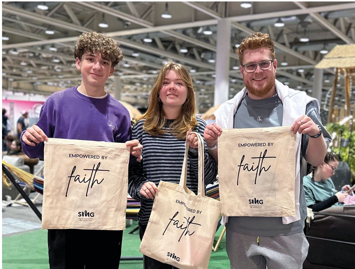
LES SACS DISTRIBUÉS PAR LA SMG SONT DEVENUS UN ACCESSOIRE TRÈS PRISÉ LORS DU PRAISECAMP 2024.

L'année dernière, la SMG a reçu plusieurs legs. Ils sont l'expression d'un attachement profond à la mission mondiale – au-delà de sa propre vie. Nous sommes très reconnaissants de cette confiance.