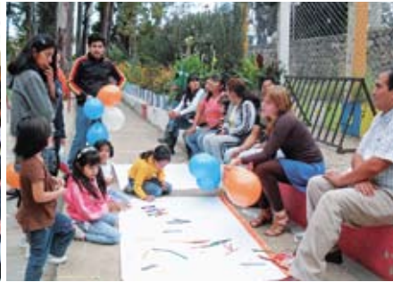
Das Gelernte gleich umzusetzen: evangelistischer Einsatz