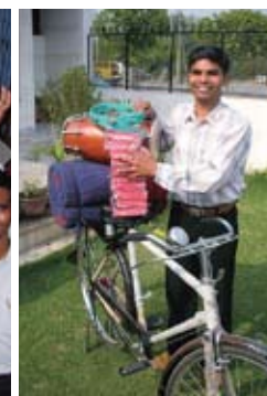
«Start-Ausrüstung» für Gemeindegründung