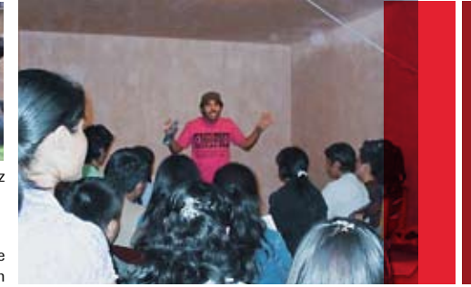
rechts: Hier lernen die Jugendlichen gerade neue, kreative Evangelisationsmöglichkeiten