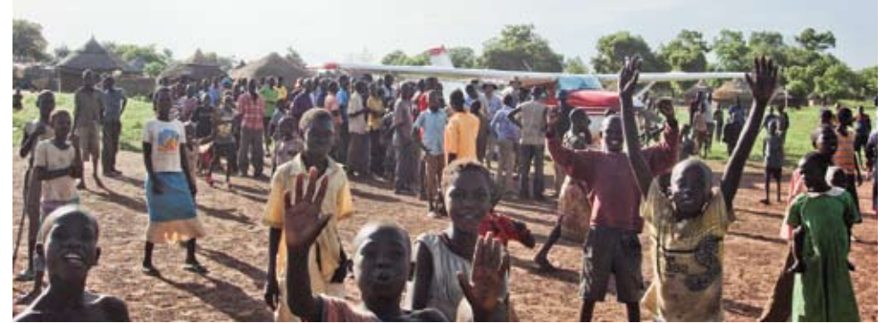
Unterwegs mit AidSudan: erste Landung in Mvolo (Sudan) nach über zehn Jahren

Leute und Güter via Landweg in abgelegene Gebiete zu bringen dauert oft Tage oder Wochen und ist in der Regenzeit häufig sogar unmöglich. Manchmal gibt es gar keine Strassen oder sie sind wegen Rebellen oder sonstigen Kriegshandlungen zu gefährlich. Jahrelang versorgte z.B. die MAF während dem Rebellenkrieg im Norden von Uganda verschiedene Krankenhäuser mit Medizin und Personal. Das Personal der Organisationen, die trotz des Krieges ausharrten und weiter arbeiteten, mussten auch fast ausschliesslich hinein- und herausgeflogen werden. Die Alternative war ein schwerbe-