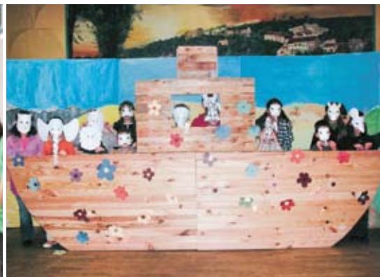
Die Geschichte Noahs