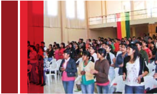
Ostern 2011: Mini CIMA in Tarija – Plenarveranstaltung